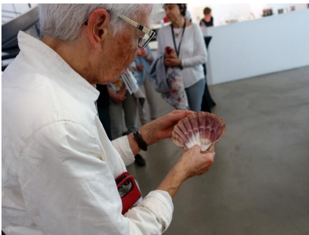
Eine Muschel zum Tasten