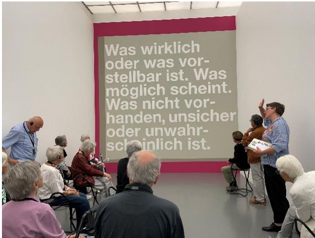
Welche Bedeutung hat der Text auf dem Bild?

Am 7. Juni 2022 erlebten wir auf einer spannenden Führung die Sammlung des Kunsthauses im Wandel der Zeit, von der Vergangenheit in die Gegenwart und einen Blick in die Zukunft.