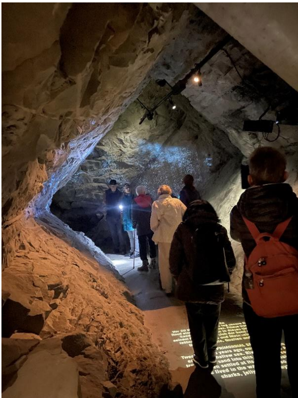
Gang durch die Felsenwelt

Im Anschluss stärkte sich die Gruppe im nahen Restaurant bei einer warmen Mahlzeit, bevor die Heimreise mit dem Zug angetreten wurde.