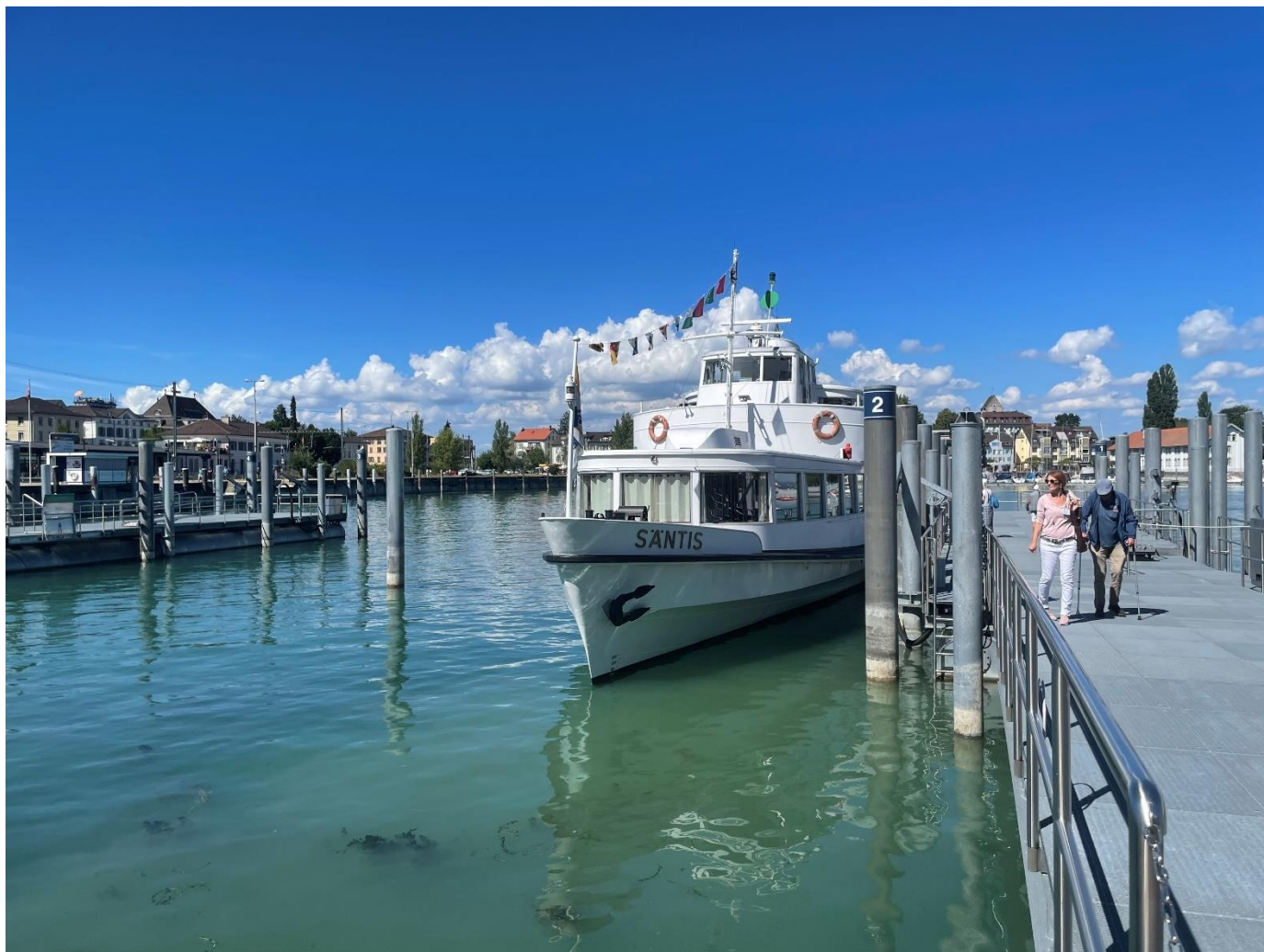
MS Sántis am Schiffsteg von Romanshorn