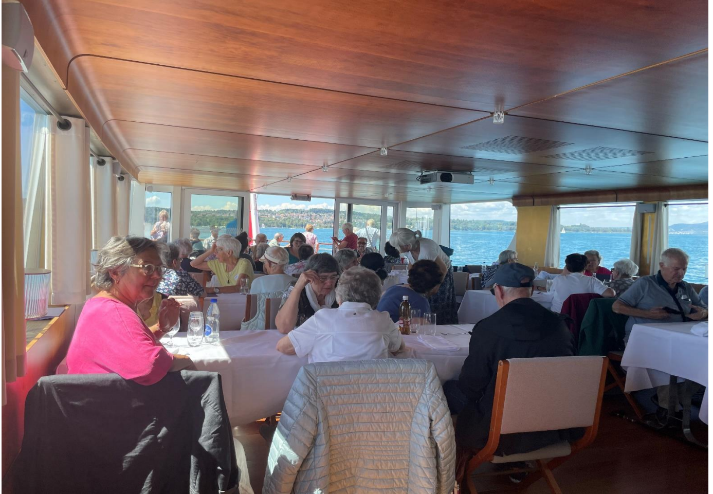
Im Speisesaal der MS Sántis