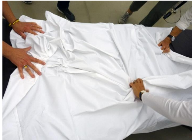
Das Leintuch auf dem Bild kann betastet werden