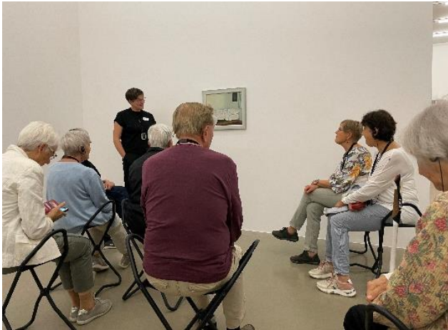
Teilnehmende lauschen der Bildbeschreibung

Bei beiden Anlässen konnte der beliebte Abschluss im Atelier mit Kaffee und feinem Kuchen wieder stattfinden.