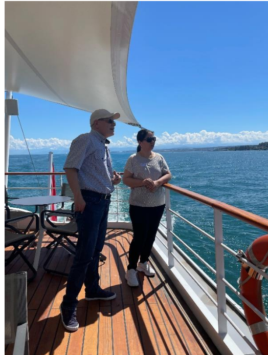
Auf dem Aussendeck