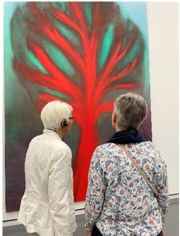
Bildbetrachtung von Teilnehmenden