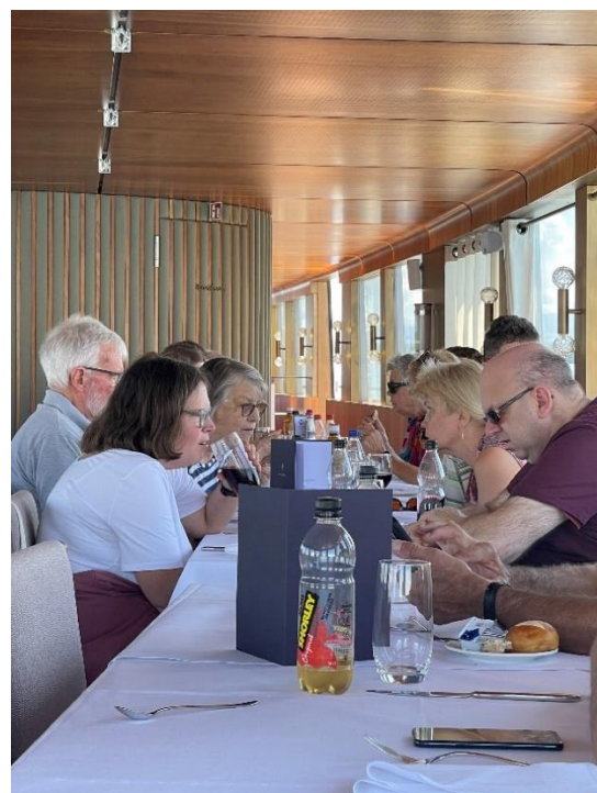
Gäste beim Essen