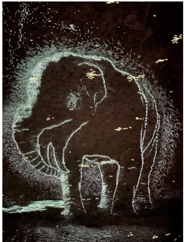
Projektion eines Mammuts