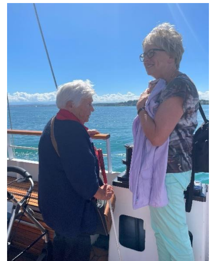
Gäste geniessen das Wetter