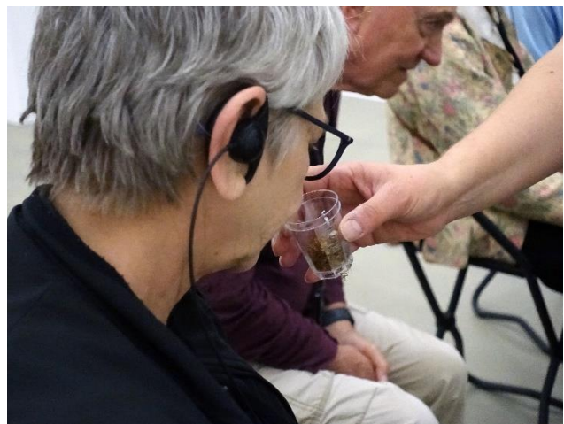
Der Geruchssinn wird angeregt