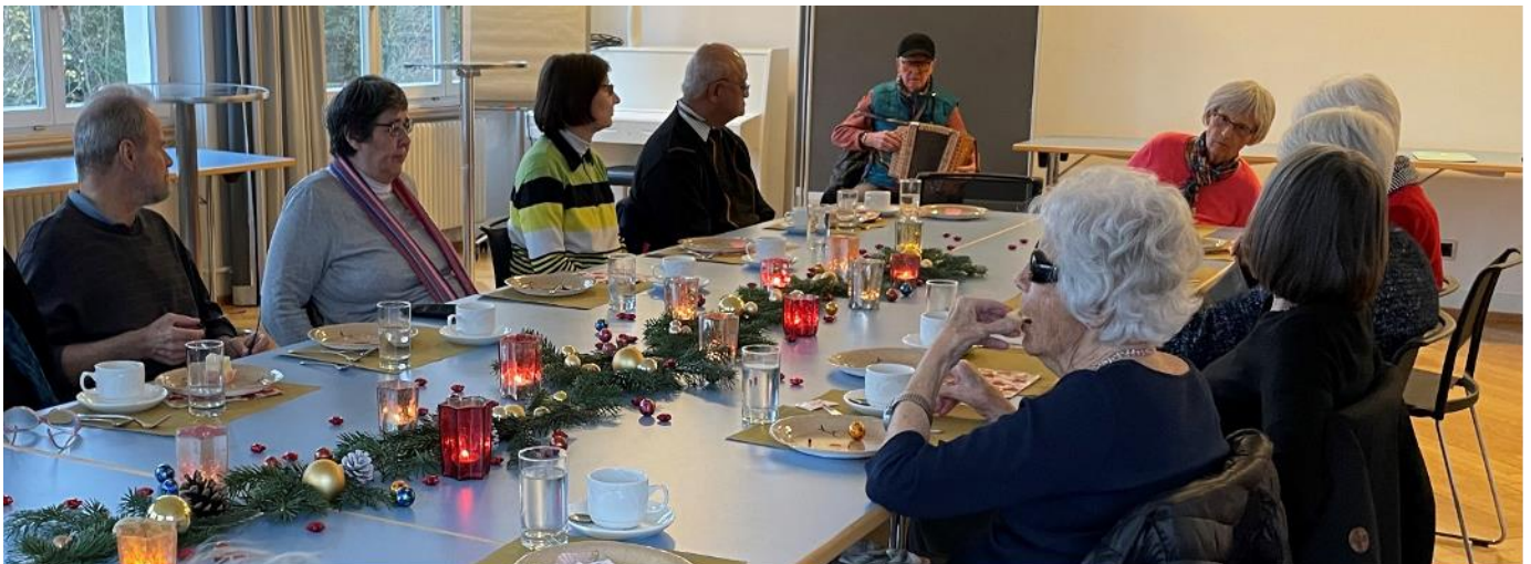
Gäste am festlich gedeckten Tisch